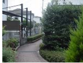
グリーンセンター付近