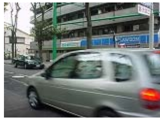
けやき商店街 ローソン

暗くなると、人気が無く寂しい 他校生も来る ・トラブルに注意 信号無視をする人もいる