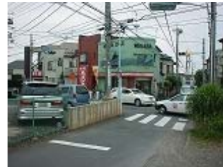
ワカバサイクル前

・道が細い 危険 ・一方通行だが車の量が多く、スピードも出している。大型車にも注意