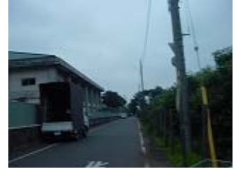
九中周り(体育館側)