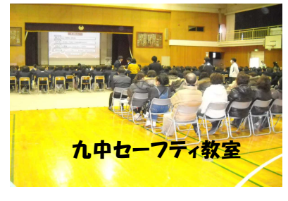
九中セーフティ教室